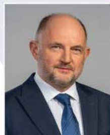
Piotr Całbecki Marszałek Województwa Kujawsko-Pomorskiego

W obliczu dynamicznie rozwijającego się świata zmiany kształtowane przez szereg uwarunkowań społecznych, technologicznych, środowiskowych i politycznych przechodzi także branża turystyczna. Sytuacja międzynarodowa nadała im nieprzewidywalny rytm, ale również uwypukliła pewne kierunki rozwoju.