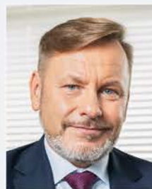
Rafał Szymtke Prezes Polskiej Organizacji Turystycznej

Wspólnie wypracowane wnioski i rekomendacje Gremium stanowiąc będą dla administracji rządowej do spraw turystyki ważną podstawę formułowania kluczowych kierunków działania i interwencji państwa na kilka najbliższych lat, przyczyniając się do zrównoważonego rozwoju sektora turystycznego oraz do tworzenia nowej jakości w zarządzaniu turystyką w Polsce.